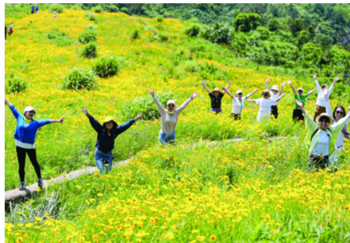
连日来，位于岑港街道马目山上的波斯菊大面积盛开，吸引了不少市民前来游玩。